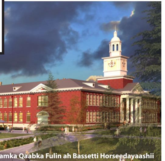
Ixtiraamka Qaabka Fulin ah Bassetti Horseedayaashii