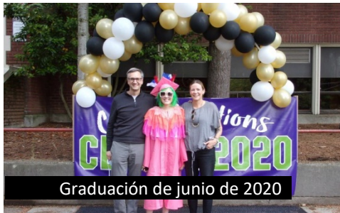
Graduación de junio de 2020