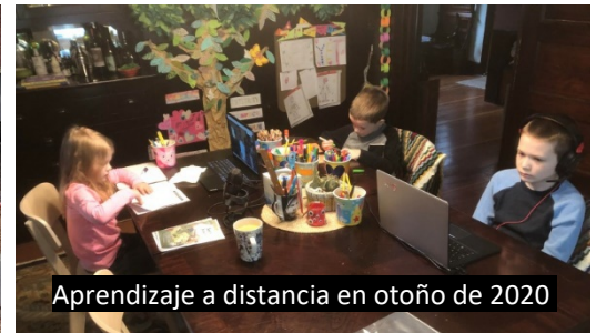
Aprendizaje a distancia en otoño de 2020

Evalúe MLC si está buscando una experiencia de aprendizaje personalizada en la que el estudiante sea valorado en la comunidad y esté interesado en la ciudad como su salón de clases.