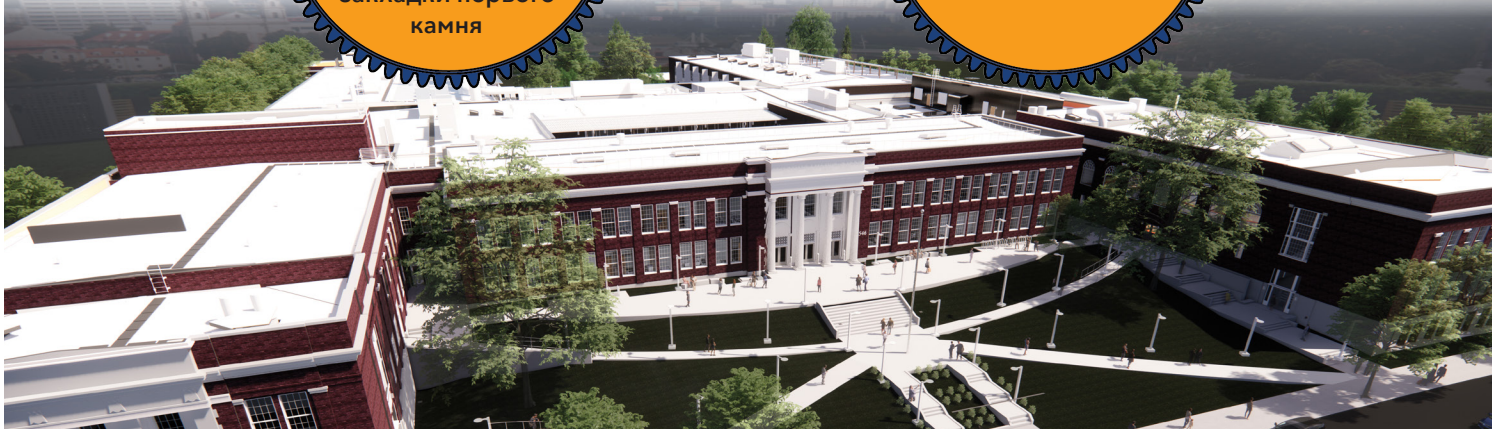
График Реализации Проекта

11:00–13:00 Экскурсия по территории школы