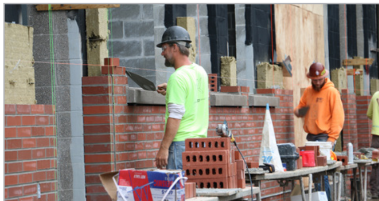
Завершение кладки кирпича