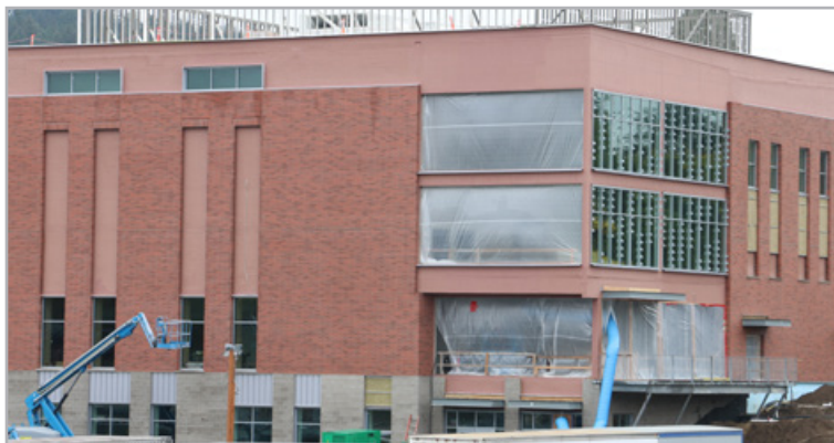
Подходит к концу строительство нового здания для спортзала/ биомед.центра/кулинарии